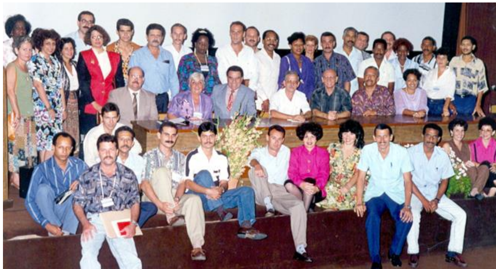
Fig. 2 Miembros fundadores de la Sociedad Cubana de Reumatología

Miembro fundador de la Sociedad Cubana de Reumatología, ocupó responsabilidades en la misma y ha participado por la Sociedad Cubana de Reumatología en eventos nacionales e internacionales.