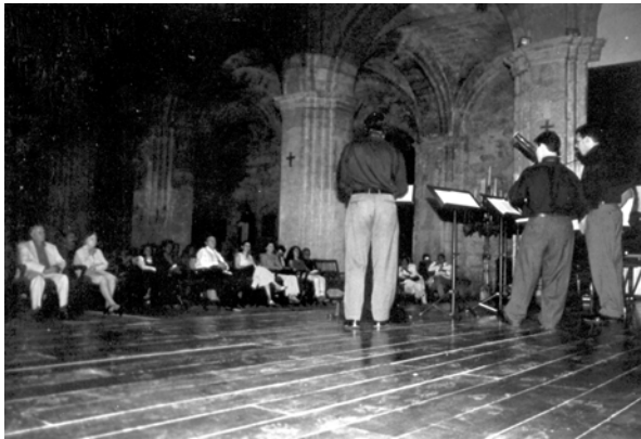
Concierto en la Basílica de San Francisco de Asís en La Habana Vieja.