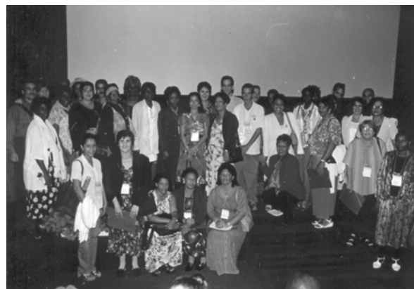
Colectivo de Enfermeras de Reumatología