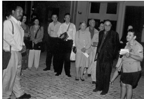
Paseo por la Habana Vieja