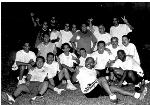
Equipo de Futbol ganador de la SCUR