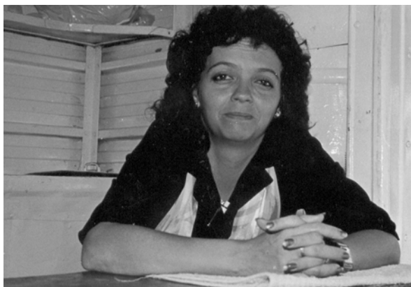
Administradora del Congreso