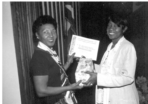
Entrega de Premio en el Pre-Congreso de Enfermería