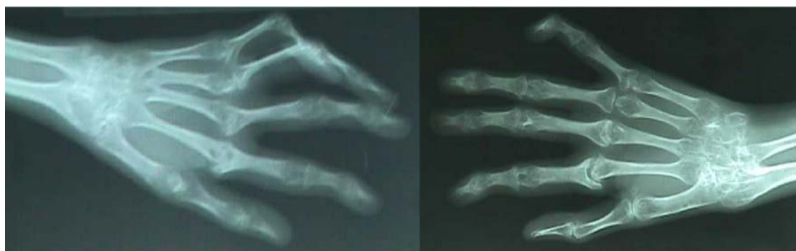
Foto N°1. Avanzados cambios radiológicos de tipo destructivo en una Artritis Reumatoide clase funcional 4.

En los pacientes objeto de estudio, el índice de HAQ, promedio estuvo sobre el puntaje de 2 en 22 que representa el 16.9% de la serie lo cual habla de un marcado nivel de incapacidad. Fueron sometidos a cirugía 20 pacientes de los cuales a 16 (12.3%) se les realizó cirugía de mínimo acceso por el método artroscópico con la realización de sinovectomías, debridamiento articular o lisis, por sepsis intraarticular, condroplastia y menisectomías parciales entre otras técnicas. Once pacientes (8.4%) requirieron de ortésis. En el orden terapéutico 90 pacientes (69,2%) utilizaron tratamiento inductor de remisión conservándolo actualmente 52 pacientes (40%). En total 38 (29.2%) usaron esta droga por menos de un año, siendo las causas fundamentales del abandono, la suspensión por toxicidad, poco apego a las consultas y tratamiento, y disponibilidad de las dro-