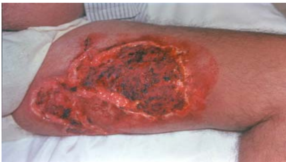
Foto N°2. Pioderma Gangrenoso por vasculitis como expresión extrarticular grave de Artritis Reumatoide

otros trastornos como la participación pleuropulmonar. Se ha señalado como frecuente la participación del pulmón como expresión extra-articular de la A. Reumatoide. Se considera una expresión grave capaz de causar la muerte entre este tipo de pacientes después de las infecciones: Incluye el derrame pleural, participación intersticial, bronquiolitis y necrobiosis de nódulos reumatoideos pulmonares (26-28). Nosotros hallamos 4 pacientes 3% con fibrosis pulmonar intersticial y uno con derrame pleural. La pericarditis se ha señalado presente en 30-40% de las autopsias, la miocarditis 10-20% y vasculitis grave 1% de los casos. Nosotros pesquisamos 2 casos con vasculitis grave de miembros inferiores uno de los cuales adquirió caracteres de Pioderma Gangrenoso tributario de tratamiento con citotóxicos en bolos como la ciclofosfamida tal como ha sido señalado.(29-30) (Foto N° 2)