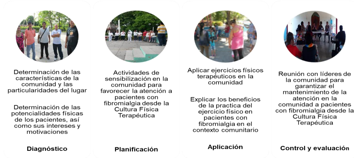
Figura 2. Componentes y acciones del subsistema metodológico de la concepción teórico-metodológica para la atención a pacientes con fibromialgia desde la CFT en la comunidad.

El subsistema metodológico reacciona como elemento operativo y posee carácter orientador sobre su praxis. Está caracterizado por los componentes: diagnóstico, planificación, aplicación, y control y evaluación. En su interior poseen un grupo de acciones que propician una relación dialéctica, su dinámica continua posibilita la retroalimentación de los demás componentes. En la figura 2 se muestra un ejemplo.