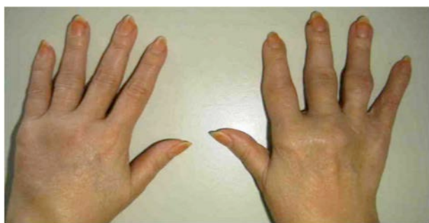
Figura 1. Edema y artritis en metacarpo e interfalángicas proximales

En el 2011, la paciente retorna a control de reumatología sin actividad del LES (SLEDAI: 2), con infección por el VHC, presentando cuadro de poliartralgia en codos, manos y muñecas, simétrica, con edema y rigidez matinal mayor de 1 hora. (Figura 1).