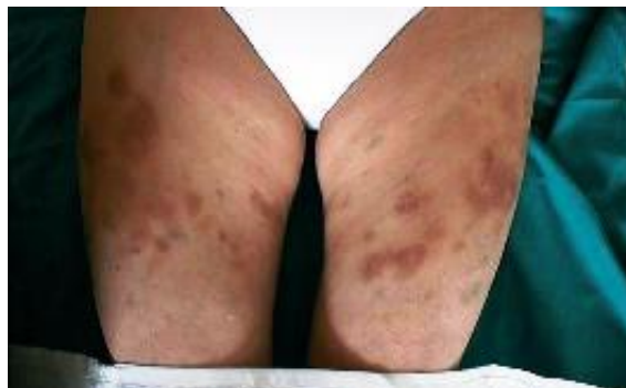
Figura 1. Equimosis en ambos muslo

Todos los complementarios de laboratorio estuvieron en rangos normales, incluyendo los estudios de coagulación con la cooperación del Instituto de Hematología. No hubo indicios de actividad de su enfermedad de base. Los exámenes radiológicos y ecográficos resultaron normales.