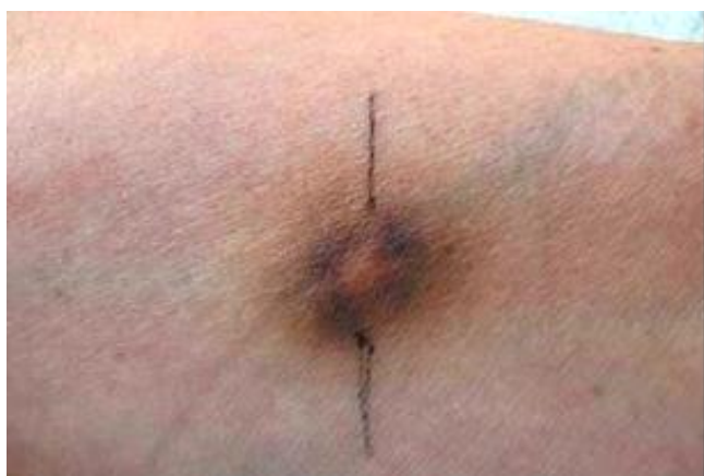
Figura 2. Equimosis en zonas de punción intradérmica de lavado eritrocitario autólogo de la paciente

Conducta: Valoración por parte de la Psicóloga y la especialista en Psiquiatría. Amitriptilina: 25 mg/día administrada a las 9 PM. (1 tableta) Clordiazepoxido: 10 mg (½ tableta) en tres tomas separadas cada 8 horas. Programación de sesiones de psicoterapia. Mantener el tratamiento que llevaba para su enfermedad de base.