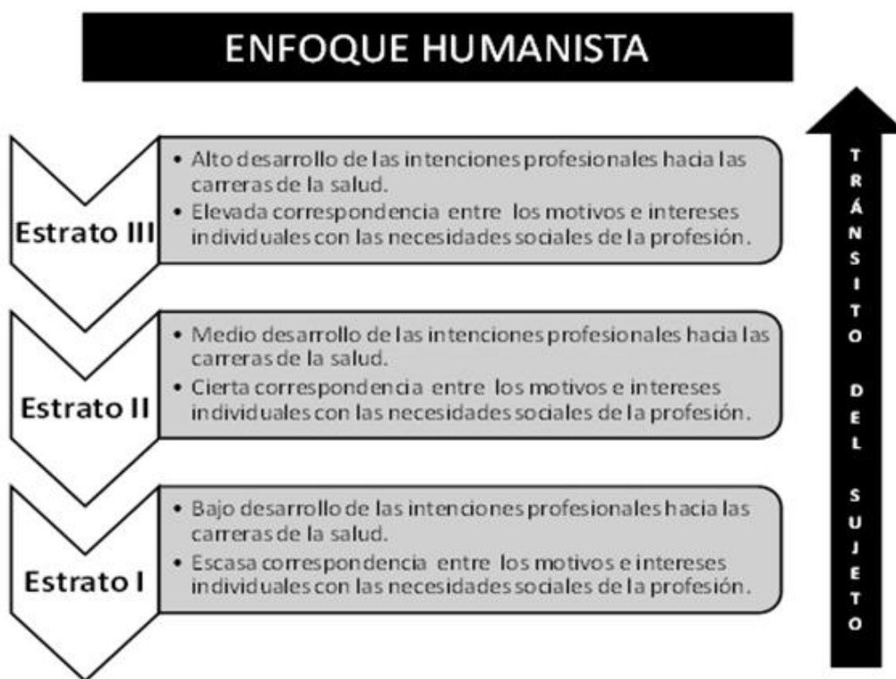
Figura 1. Modelo de escala pedagógica del desarrollo de las intenciones profesionales hacia las carreras de la salud.

Para operacionalizar la definición anterior se propone una escala pedagógica constituida por 3 estratos que describen el desarrollo de las intenciones profesionales hacia las carreras de la salud. En cada estrato se precisa el grado de correspondencia entre los motivos e intereses del sujeto con las necesidades sociales de la profesión [Figura 1]