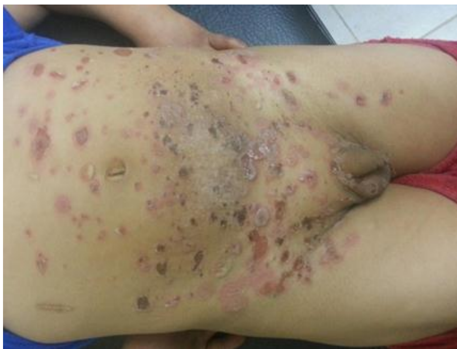
Figura 1. Lesiones pustulosas en abdomen y raíz de los miembros inferiores.

Se comenzó tratamiento con esteroides, inmunosupresores y medidas locales obteniéndose una mejoría significativa del estado clínico del paciente, en la actualidad asiste con regularidad a consulta externa del Hospital Andino de Chimborazo.