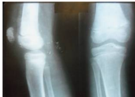
Rayos x antero-posterior y lateral de rodilla derecha

Al retirar el yeso se aprecia la rodilla aumentada de tamaño y de consistencia dura con intenso dolor local, se realiza radiografía de ambas rodillas observándose lesiones osteolíticas y osteoescleróticas en la extremidad distal del fémur con reacción perióstica localizada a nivel de la epífisis de crecimiento, así como aumento de la opacidad de las partes blandas vecinas al fémur. imagen2