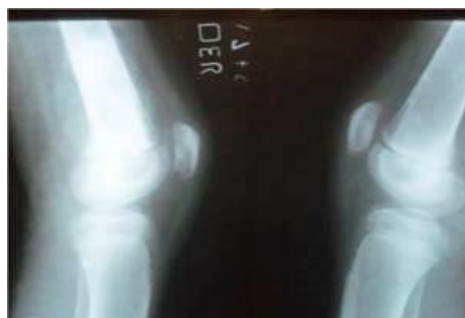
Rayos x ambas rodillas vista lateral

Es remitido del hospital pediátrico William Soler a la consulta de ultrasonido de partes blandas del Instituto de Medicina Deportiva para realizar estudio de imágenes de la zona afectada.