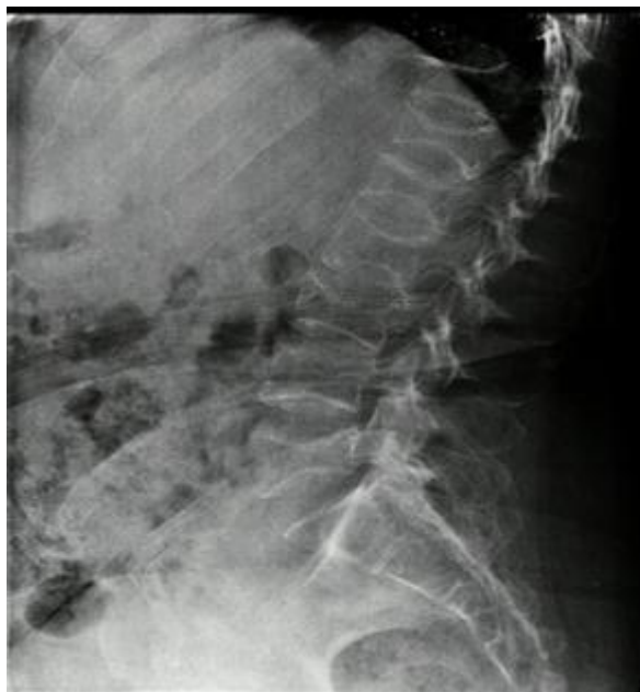
Fig. 3 Aplastamiento múltiple de vertebrales tóraco-lumbares

Caso 3: Paciente femenina, de 35 años con dolor lumbar de 3 meses, tipo inflamatorio, sin síntomas neurológicos. En las imágenes radiográficas ( figura 3 ) presenta aplastamientos vertebrales múltiples, laboratorio con pico gamma monoclonal de tipo IgG, parámetros de metabolismo fosfocálcico normal. Se realiza biopsia de médula ósea compatible con MM. Posterior al diagnóstico esta paciente fue derivada al servicio de oncología para su manejo.