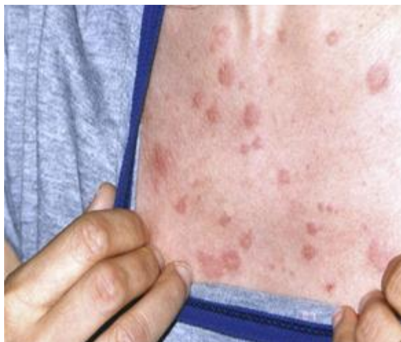
Fig. 1 Lesiones maculopapulares en el tórax propias del síndrome de Snichtzler

monoclonal IgG y en la biopsia de piel se informa vasculitis leucocitoclástica. Diagnóstico: síndrome de Snichtzler. La paciente desarrollo un MM 9 años después.