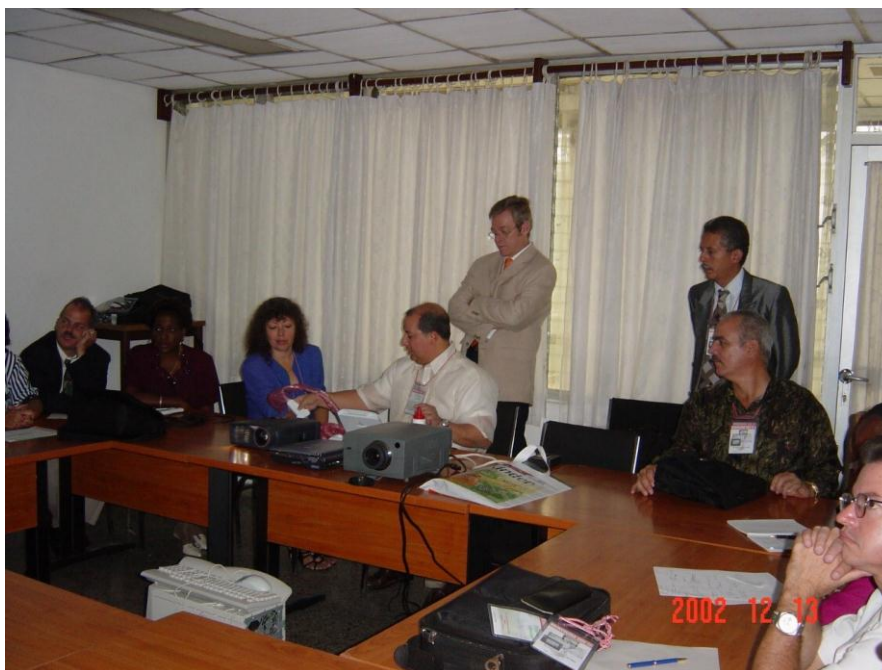
Fig. 4 Fotografía del profesor Anthony Bouffard (MD) de los E.U, director y participante en el Workshop Hollander In memorian en Filadelfia, en el Core de Ultrasonografía de avanzada. Posteriormente participo como profesor durante el primer curso básico de Ultrasonografía MSE, celebrado en el Congreso cubano de reumatología 2002 junto al profesor C. Pineda de México

En el workshop el staff de especialistas de elevado nivel de Europa y E. Unidos desarrolló una apretada y excelente agenda en la cual abordaron los principales temas de punta en ese período sobre las técnicas básicas de la ultrasonografía y su aplicación teórica y sesiones prácticas en sujetos vivos con modernos equipos de US. (11)