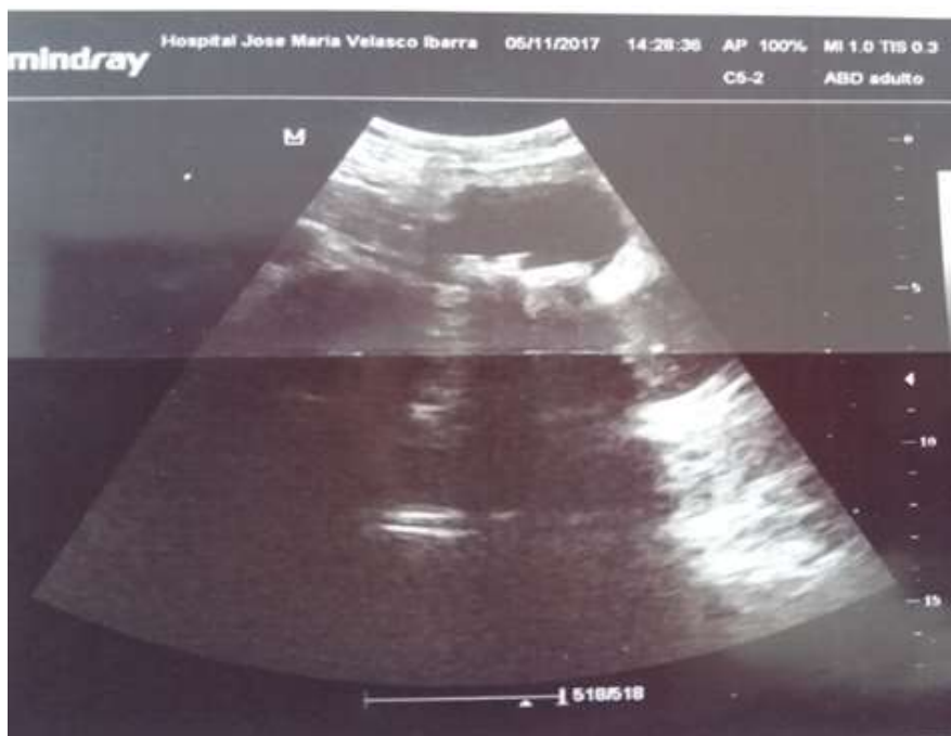
Figura 1. Imagen de ecografía de abdomen superior donde se observa dilatación de las vías biliares intrahepáticas y de la vesícula biliar; con presencia de litiasis en el interior de la vesícula biliar.

Se comenzó tratamiento de urgencia con la administración de hidratación parenteral con solución salina al 0,9% a 14 gotas por minutos; se administró 40 mg de omeprazol por vía endovenosa y ante la exacerbación del dolor se prescribió el uso de 100 mg intravenoso de tramadol y ondasetrón 8 mg intravenoso.